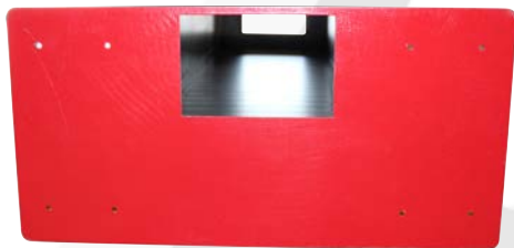
BIE 25 Fija