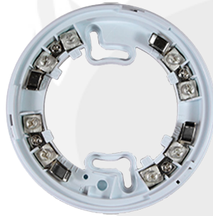
Base de 9 terminales perfil bajo