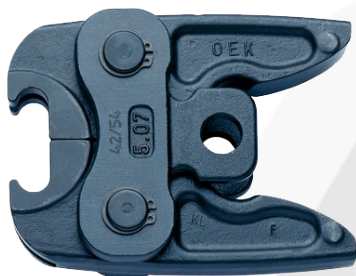
Adaptador para los lazos.