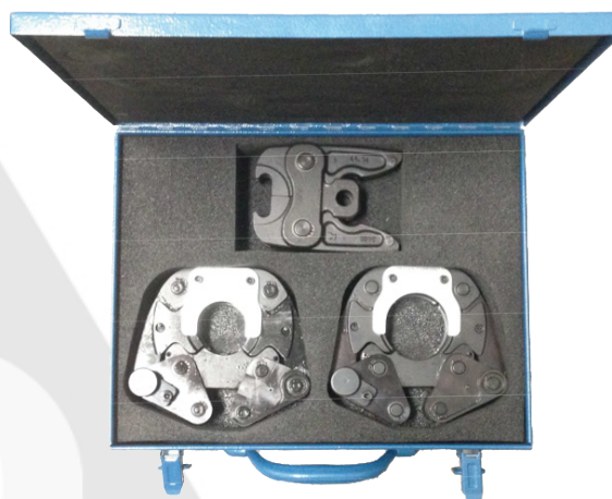
Caja metálica + lazo 42 + lazo 54 + adaptador.

Suministro de cargadores y fuentes de alimentación específicos según el país.